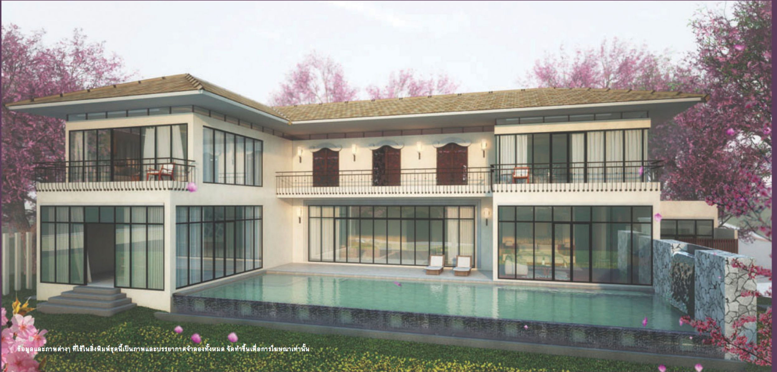
ข้อมูลและภาพต่างๆ ที่ใช้ในสิ่งพิมพ์ชุดนี้เป็นภาพและบรรยากาศจำลองทั้งหมด จัดทำขึ้นเพื่อการโฆษณาเท่านั้น

บ้านสไตล์บาฮาลีโมเดิร์นที่ภายในตกแต่งอย่างประณีต หรรษา ใสใจทุกรายละเอียดทั่วถึง เลือกสรรวัสดุอุปกรณ์คุณภาพและทันสมัย