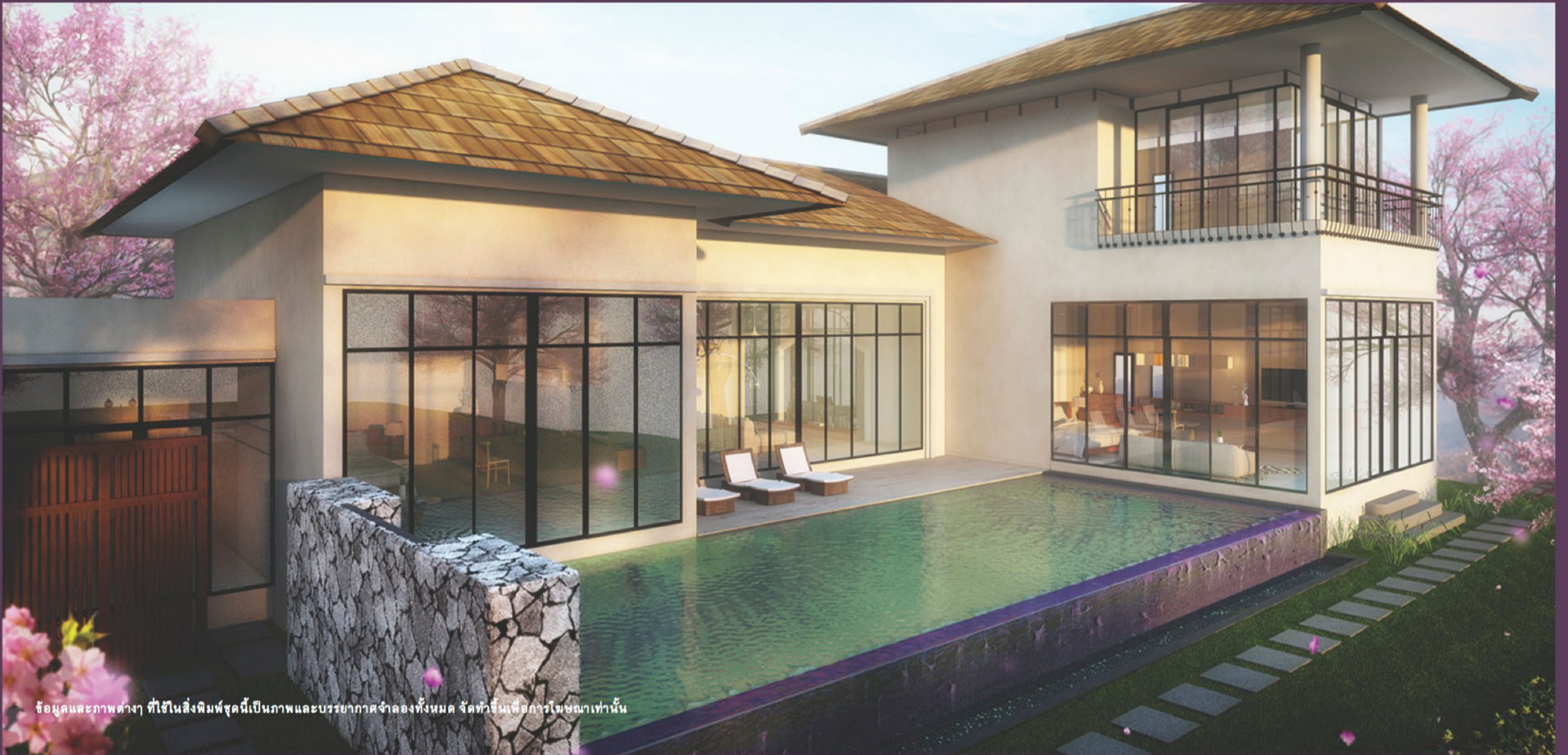
ข้อมูลและภาพต่างๆ ที่ใช้ในสิ่งพิมพ์ชุดนี้เป็นภาพและบรรยากาศจำลองทั้งหมด จัดทำขึ้นเพื่อการโฆษณาเท่านั้น

สิ่งอำนวยความสะดวกมากมาย และสไตล์การตกแต่งแนวโมเดิร์นบาหลี